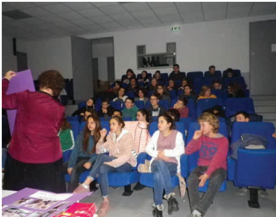
Présentation de l'association aux collégiens

Mais pour résoudre ce problème heureusement que l'agroécologie est présente.