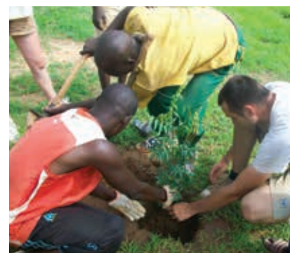
Plantation de l'arbre de l'amitié à Kangaré