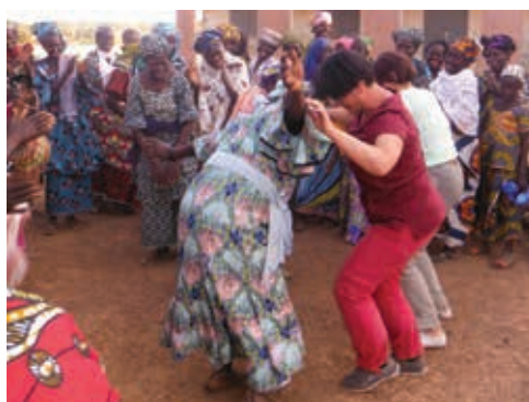
Cours de danse africaine