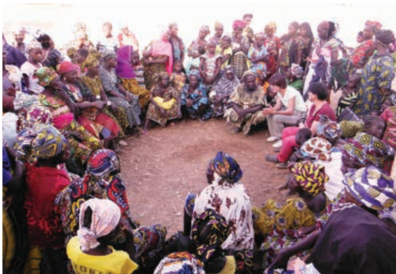
Rencontre avec les femmes de Kabana

collecter des fonds. Interpellé par la situation des 117 enfants de Djoko qui étudient sous une paillote, le comité a pris l'engagement de construire deux salles de classe pour la rentrée scolaire 2018 et pour cela a fait un appel aux dons.