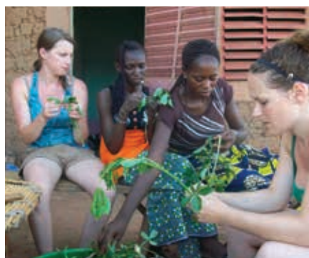
Préparation des feuilles de baobab pour la sauce