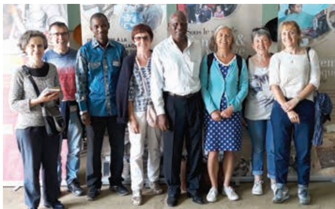
Les deux permanents maliens et le groupe de Monistrol sur Loire