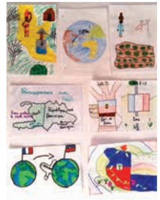
Créations artistiques des élèves de L'Arbresle