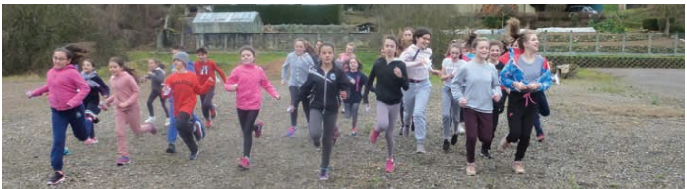
Les collégiennes en pleine course