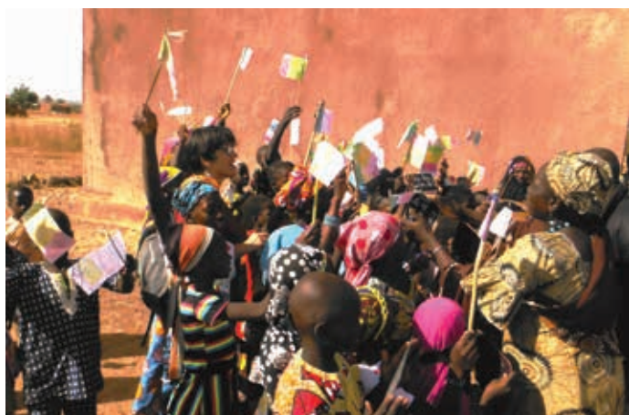
Les élèves et la maîtresse accueillent les amies françaises

Merci à nos permanents qui nous ont accompagnées partout : dans les villages où ils ont fait le lien avec les villageois, à Bamako pour nous présenter la direction de GAE Sahel, au marché et dans une boutique pour acheter de l'artisanat malien que nous avons revendu au profit de LACIM.