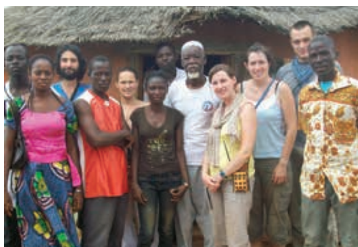
Groupe des PSF avec les villageois et le maire de Rollo

NB Voir le blog LACIM-BURKINA http://lacimburkinafaso.blogspot.fr/search/label/Jumelage%20KANGARE et le blog des PSF http://pingouinssansfrontieres.blogspot.com/